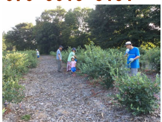
『くぬぎ野ふぁーむ』でブルーベリー摘み取り